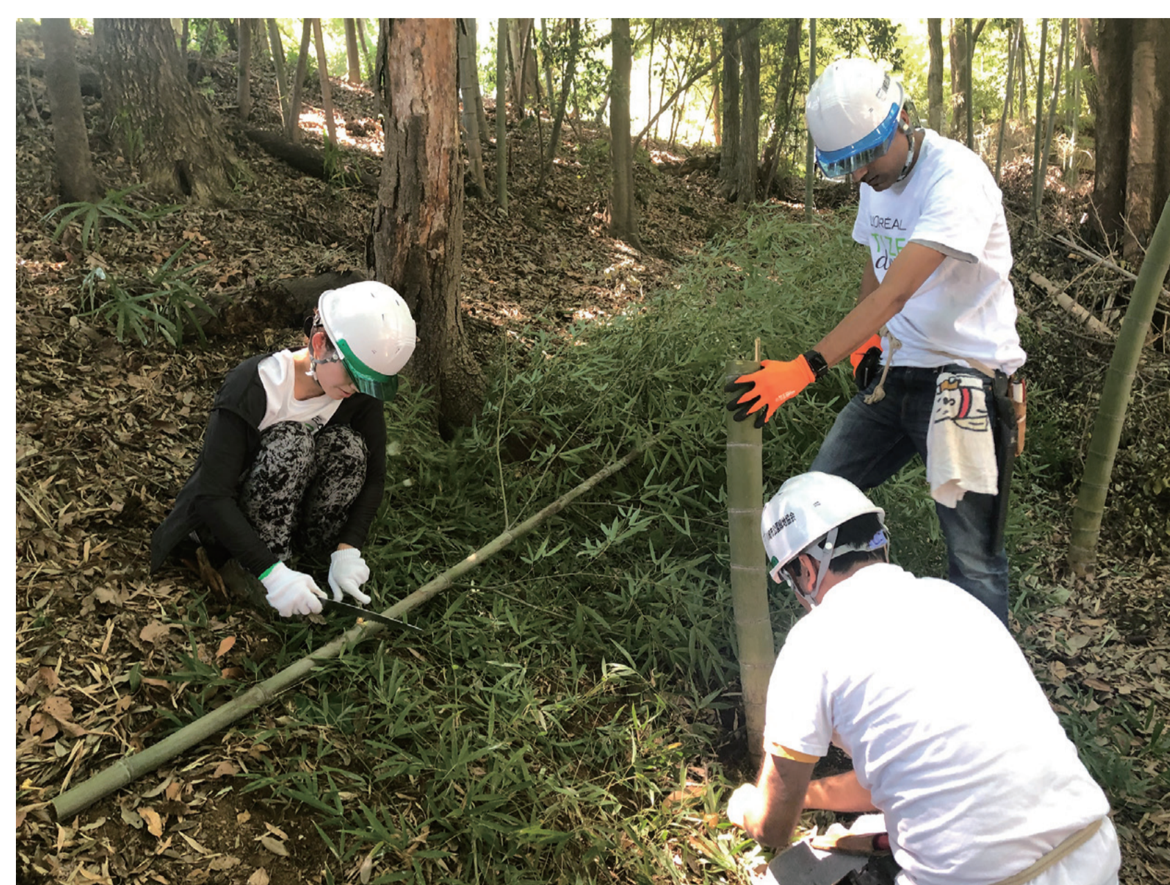
参加企業による保安全管理活動

川崎市では、企業や教育機関の参加や協力を得て、里山の保全の管理を行う「かわさき里山コラボ」の取り組みを行っています。この取組では、市が里山保全についての技術的な助言などを行い、企業などが里山の保全活動を行います。これまでに5カ所の緑地で協定を締結し保全活動を行っています。