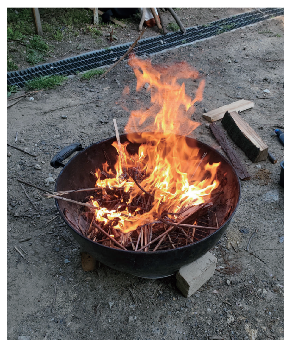
みどりにふれ合い、学ぶ自然学習（王禅寺四ツ田緑地：麻生区王禅寺字四ツ田1028-2ほか）