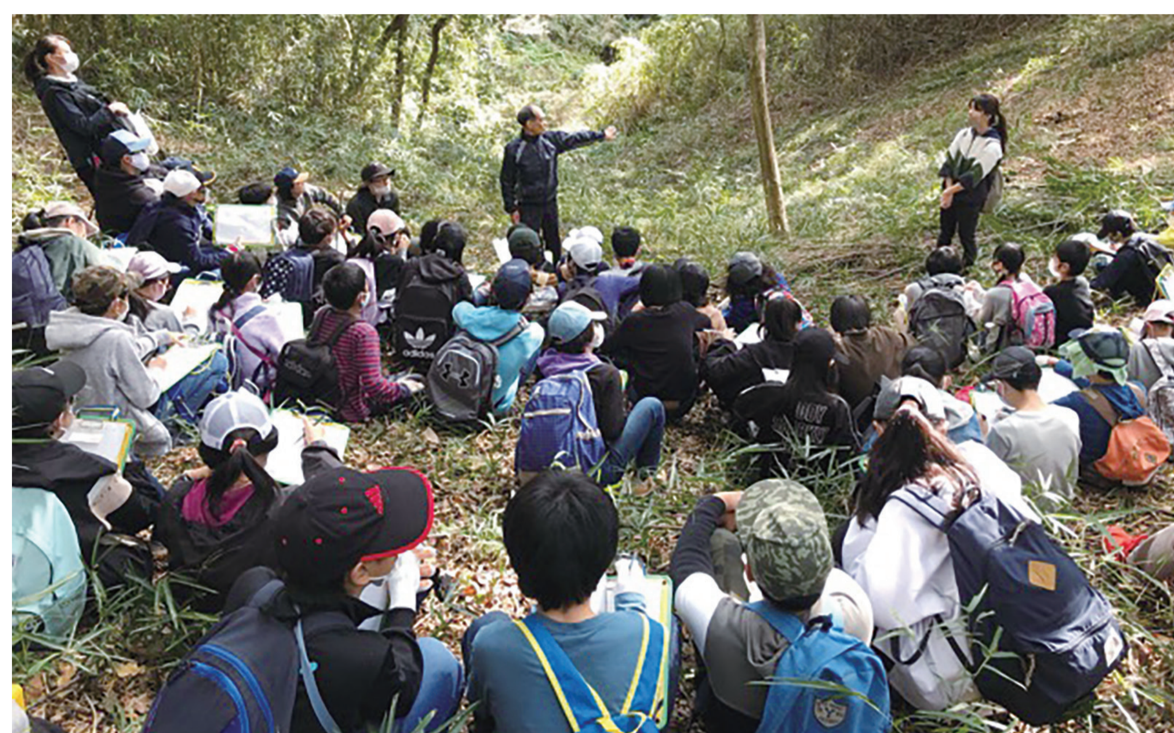
東京農業大学による環境教育

人と自然が共生する持続可能な里山環境を目指すため、自然環境の保全・育成や生物多様性についての研究に取り組んでいる大学3校と協力し、保全された緑地の多様な自然環境の維持・再生について研究を進めています。